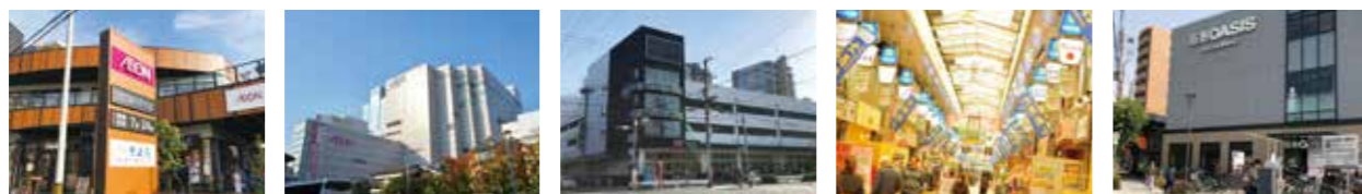
イオンそよら海老江 1分(約60m) ウイステイ/イオンスタイル野田阪神 4分(約320m) KOHYO 鷺洲店 3分(約240m) 野田新橋筋商店街 8分(約620m) 阪急オアシス福島ふくまる通り57店 8分(約600m)